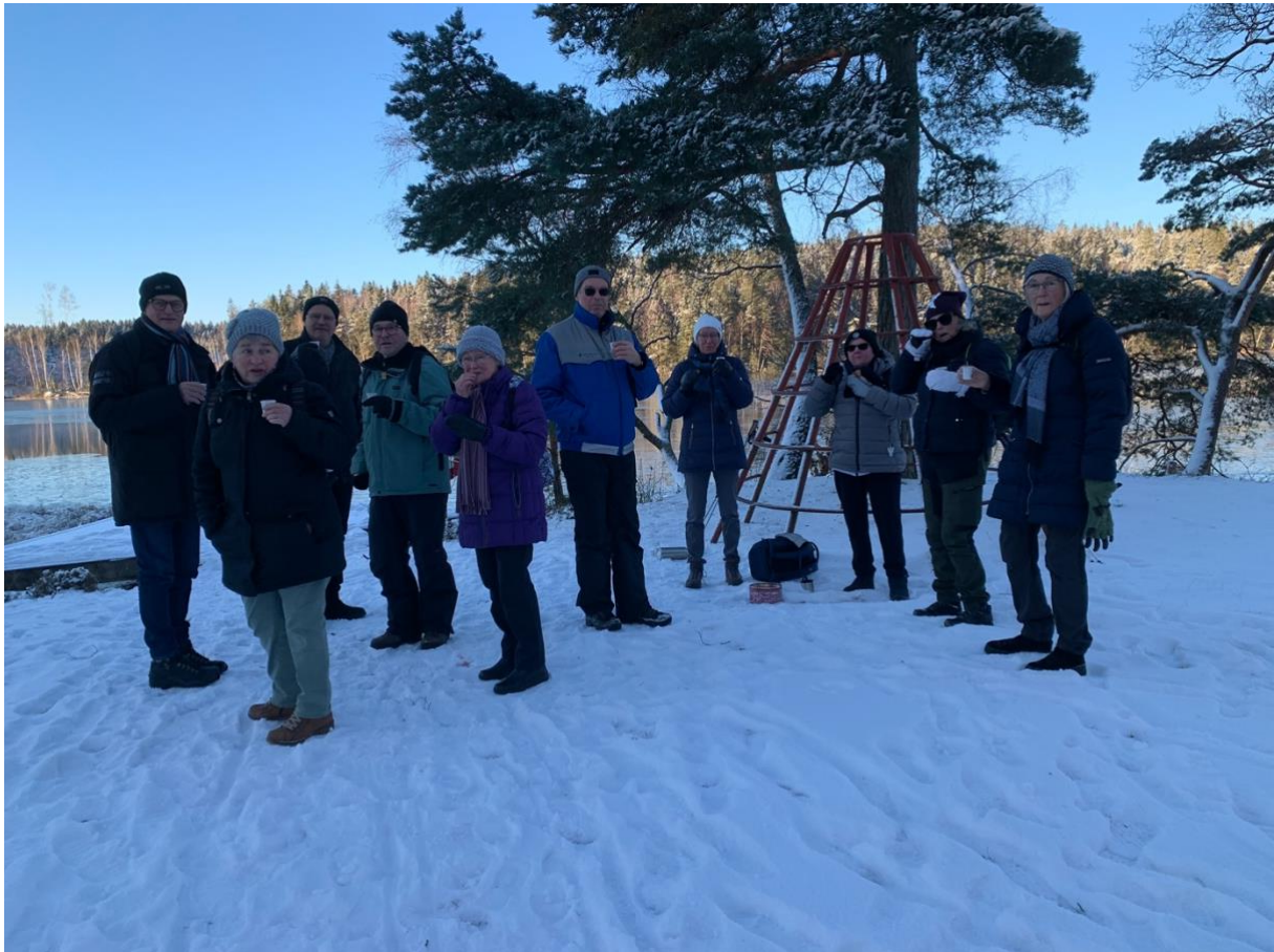
Lussefika vid Stamsjön